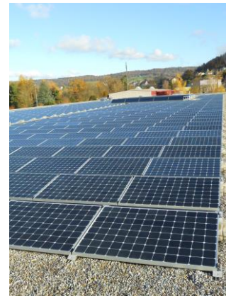
PV-Anlage Mehrzweckhalle Brühl

Eine Photovoltaik-Anlage für das neue Schulhaus Brühl 3 mit 32.94 kWp wurde geplant und bestellt. Sie wird im März 2020 realisiert.